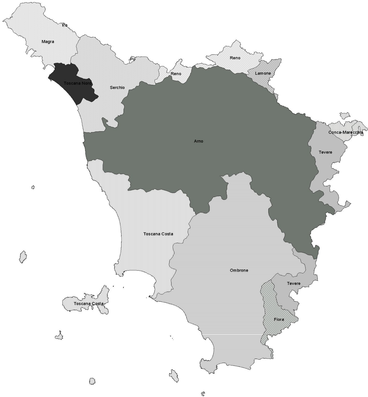
Figura 1 – Bacini idrografici della Toscana.